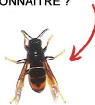
Frelon asiatique (jusqu'à 3 cm)