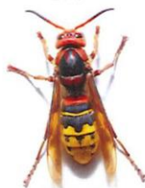
Frelon commun (jusqu'à 4 cm)